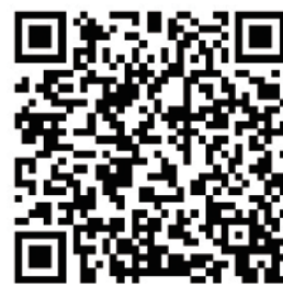
(扫描二维码,即可知龙湾已安装人行道违停电子监控的72个点)

此外,温馨提醒也不会“无限提醒”,执法人员表示将根据试点情况,通过平台大数据分析,部分车主利用“温馨提醒”在人行道恶意“蹭停”的行为,也将被处罚。